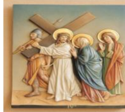
STATIONS OF THE CROSS - No. 4